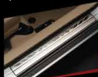
ỐP BẠC LÊN XUỐNG KHÔNG ĐÈN