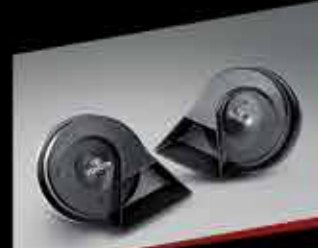
CÔI XE CAO CẤP