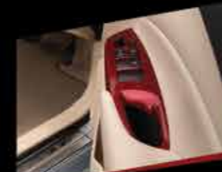
ỐP TRANG TRÍ BẠC NGHỈ TAY (MÀU ĐỎ)