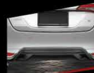
ỐP HƯỚNG GIÓ CẢN SAU (MÀU ĐEN)