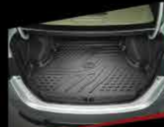
KHAY HÀNH LÝ