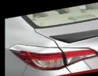
ỐP TRANG TRÍ ĐEN HẬU MẠ CHROME