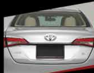
ỐP TRANG TRÍ CỬA KHOANG HÀNH LÝ MẠ CHROME