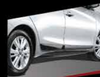
ỐP HƯỚNG GIÓ SƯỜN XE