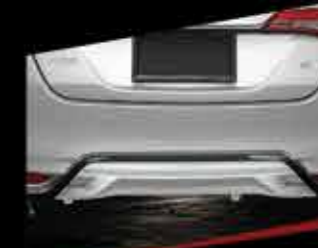
ỐP HƯỚNG GIÓ CẢN SAU (MÀU BẠC)