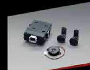
CẢM BIẾN LÙI