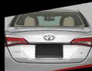
CẢNH HƯỚNG GIÓ SAU (CHƯA SƠN)