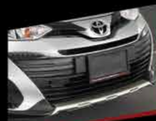
ỐP TRANG TRÍ PHÍA DƯỚI CẢN TRƯỚC