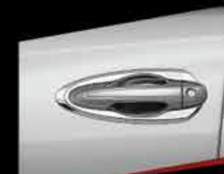
BỘ ỐP TAY CỬA MẠ CHROME