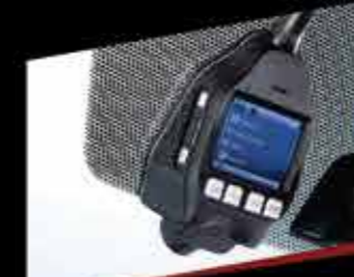
CAMERA HÀNH TRÌNH