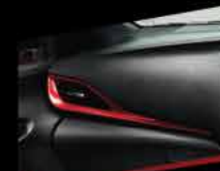
BỘ ỐP TRANG TRÍ TÁP-LÔ (MÀU ĐỎ)