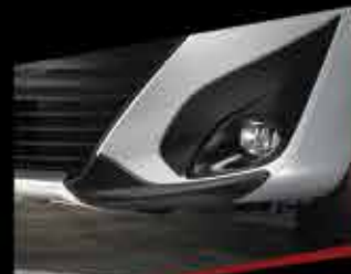
ỐP HƯỚNG GIÓ CẢN TRƯỚC